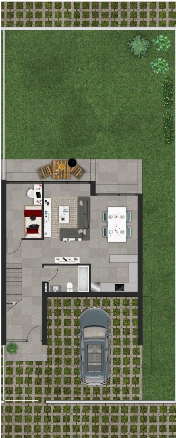
Vivienda 17 Planta baja