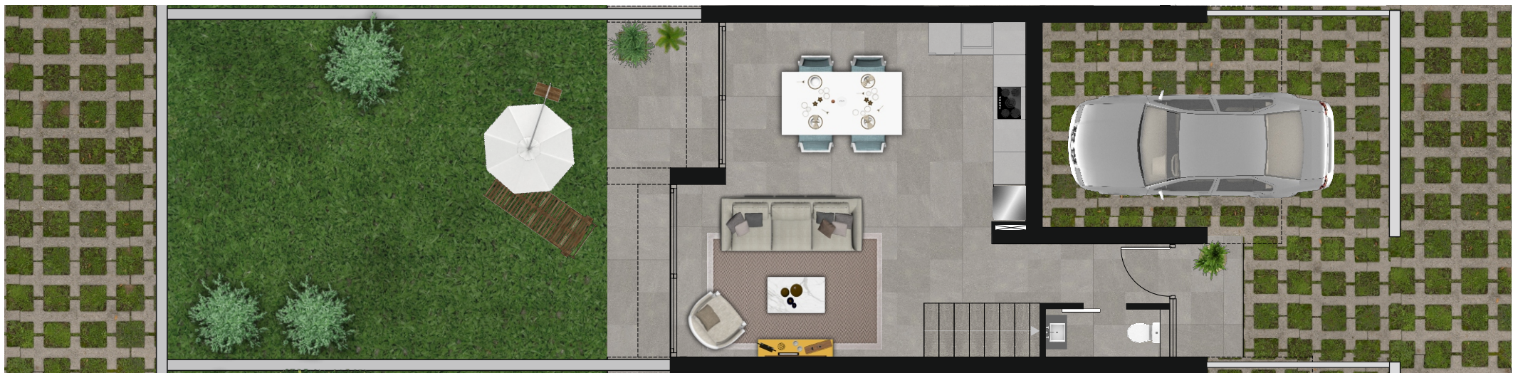
Vivienda 8 Planta baja